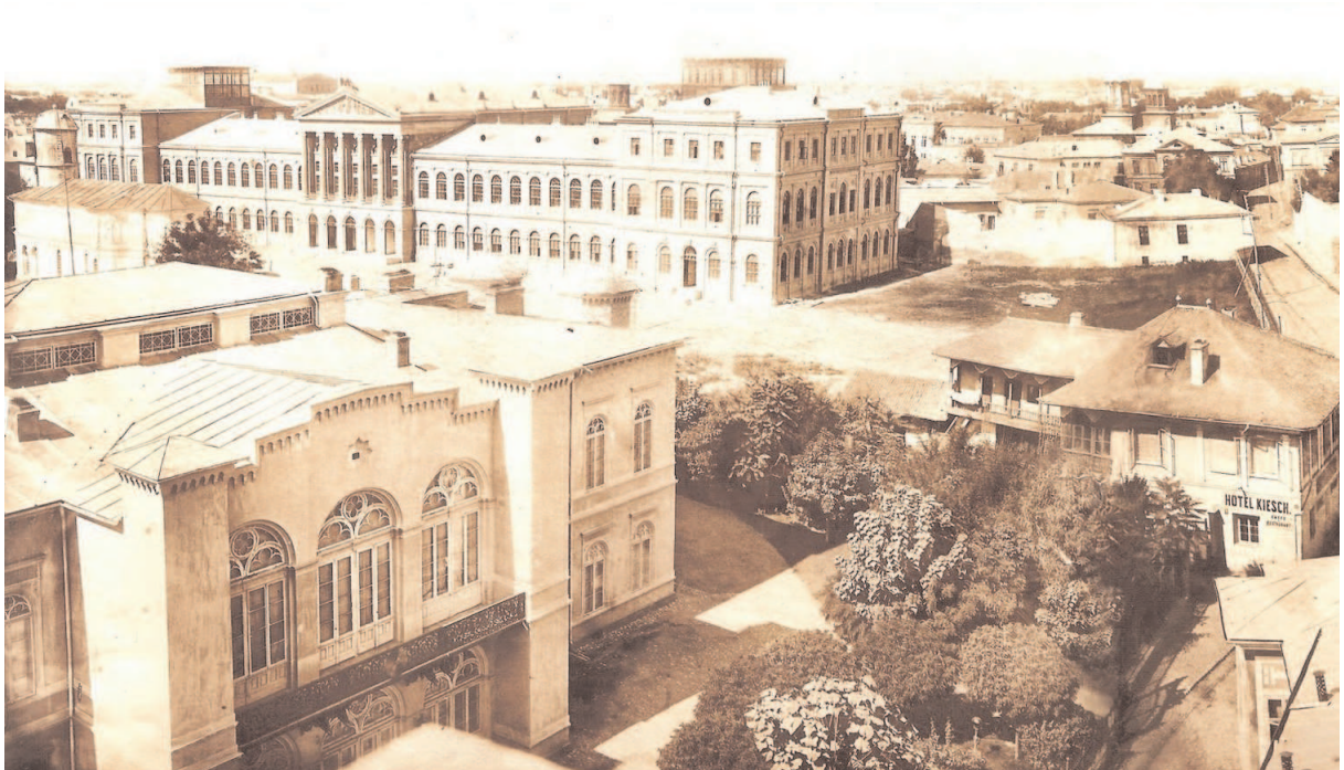
1 - Cladirea Universitatii vazuta din Turnul Coltei, fotografie de Carol Popp de Satmari, cca. 1865