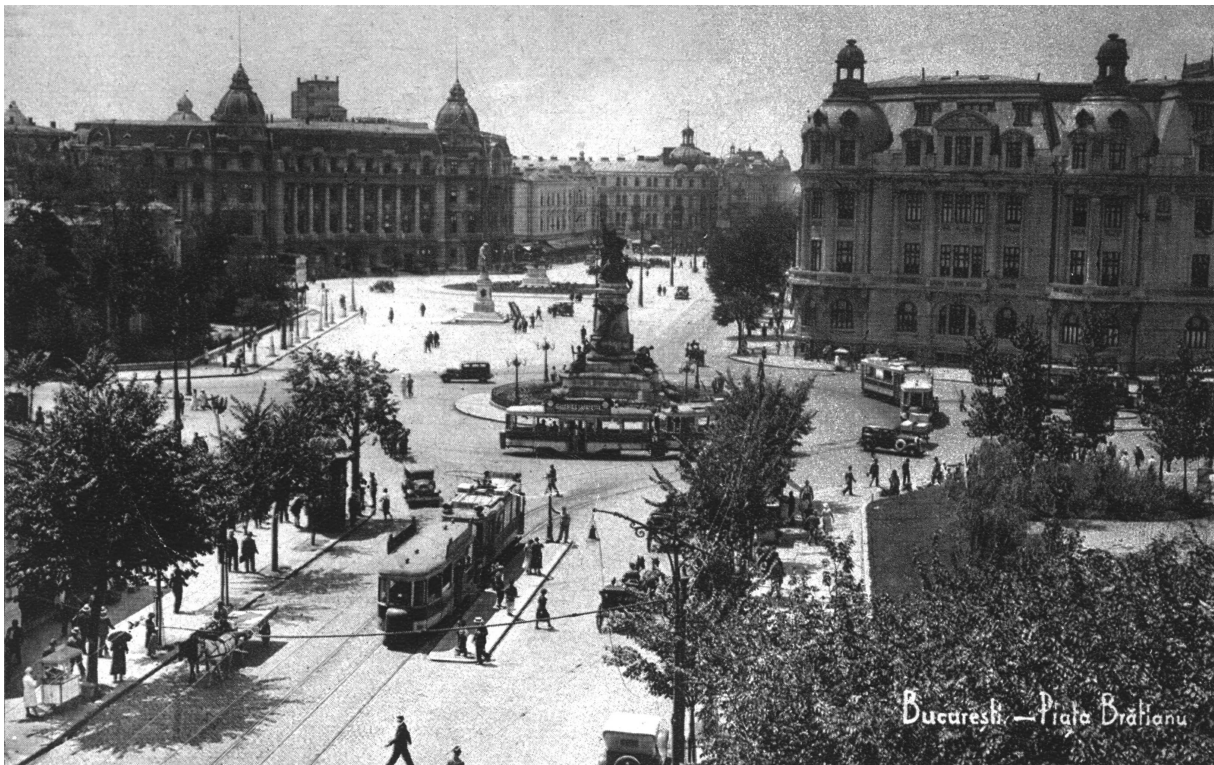
7 - Piața Universității, 1934

Planurile din 1895-1899 și 1911 indica o primă amenajare, prin degajarea statuii lui M. Viteazul, prin înconjurarea ei cu un carosabil legat de vechiul traseu, neregulat, al actualei străzi Toma Caragiu. Planul din 1912 a declanșat începutul amenajării actuale, prin cele două spații verzi situate spre strada Academiei și spre Palatul Sutu. Plantația de aliniament este reprezentată în așa fel încât pune în evidență culoarul bulevardului nu spațialitatea pietii, separând, totodată, complet, statuia lui Mihai Viteazul de celelalte statui.