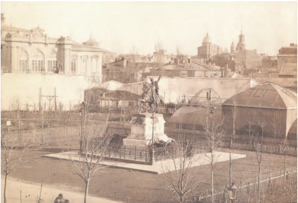
3 - Statuia lui Mihai Viteazul, 1874

militara de 10 Mai. În acel moment ea era singurul element modern pe partea bulevardului opusa cladirii Universitatii. Fotografia de epoca care s-a pastrat arata contrastul dintre suprafata înconjuratoare statuii, bine îngrijita si contextul sau: în spatele statuii se pot observa o parte a serelor aparținând gradinii botanice, in planul al doilea diferite calcane iar în stânga imaginii un fragment al palatului Sutu [3]. Organizarea viitoare a piete a avut, asadar, ca elemente generatoare axul puternic al bulevardului, masiva cladire a Universitatii si statuia lui Mihai Viteazul, ambele aflate într-o relatie bine definita unul fata de celalalt, de scari si proportii diferite, având însa ca element comun un rafinament al compozitiei si al detaliilor care ascund o forta potentiala de dezvoltare viitoare.