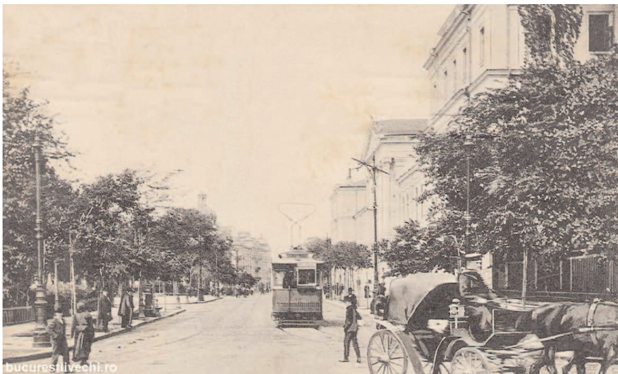
2 - Bulevardul Universitatii, 1910

rezidential. Dintre celelalte destinatii ale spatiilor, trebuie subliniata existenta, încă din epoca brîncoveneasca (1694), în cadrul manastirii Sf. Sava, a Academiei omonime (Colegiul national), una dintre cele mai importante institutii de învățămînt bucurestean, care a functionat pîna în prima parte a secolului al XIX-lea.