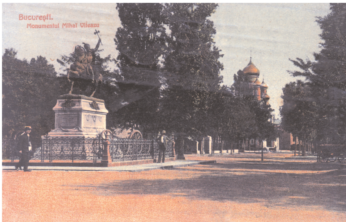
6 - Statuia lui Mihai Viteazu, începutul sec. XX

Trebuie semnalată, de asemenea, existența Palatului Sutu, sediul actual al Muzeului de istorie al Municipiului care, deși nu participă la configurația pieții, este o prezență dintre cele mai semnificative ale istoriei locului. Limita estică a spațiului pieții este situată dincolo de intersecția celor două axe majore de circulație, prin clădirile Ministerului Agriculturii și a fostului Minister de Război.