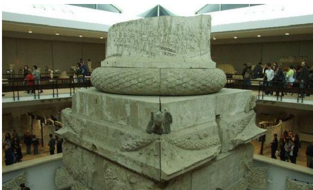
Piese din colecția MNIR: Copia Columnei lui Traian