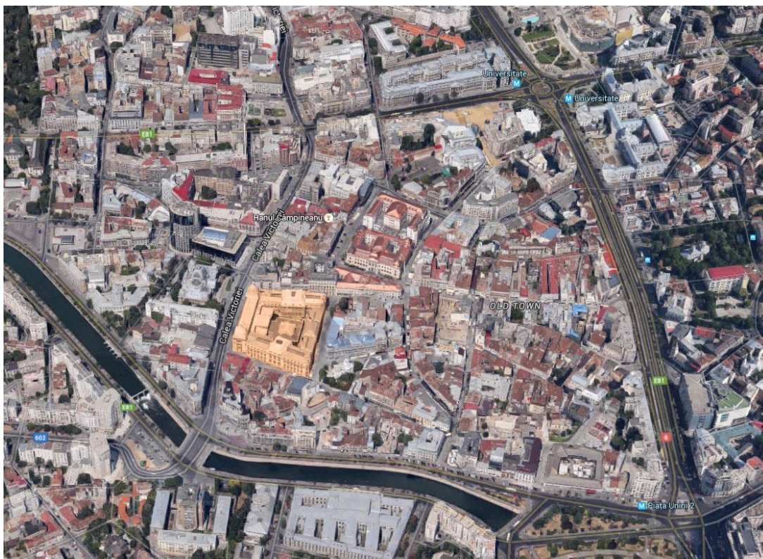
Parcela și străzile adiacente

Muzeul ocupă o întreagă insulă urbană de 10.793 mp, un teren în pantă care urcă de la vest la est și de la sud la nord. Această declivitate ar putea oferi posibilități interesante pentru realizarea de noi legături între spațiul urban și spațiile muzeului.