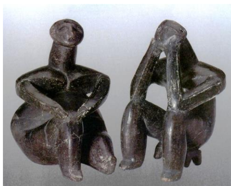
Gânditorul de la Hamangia și Femeia lui