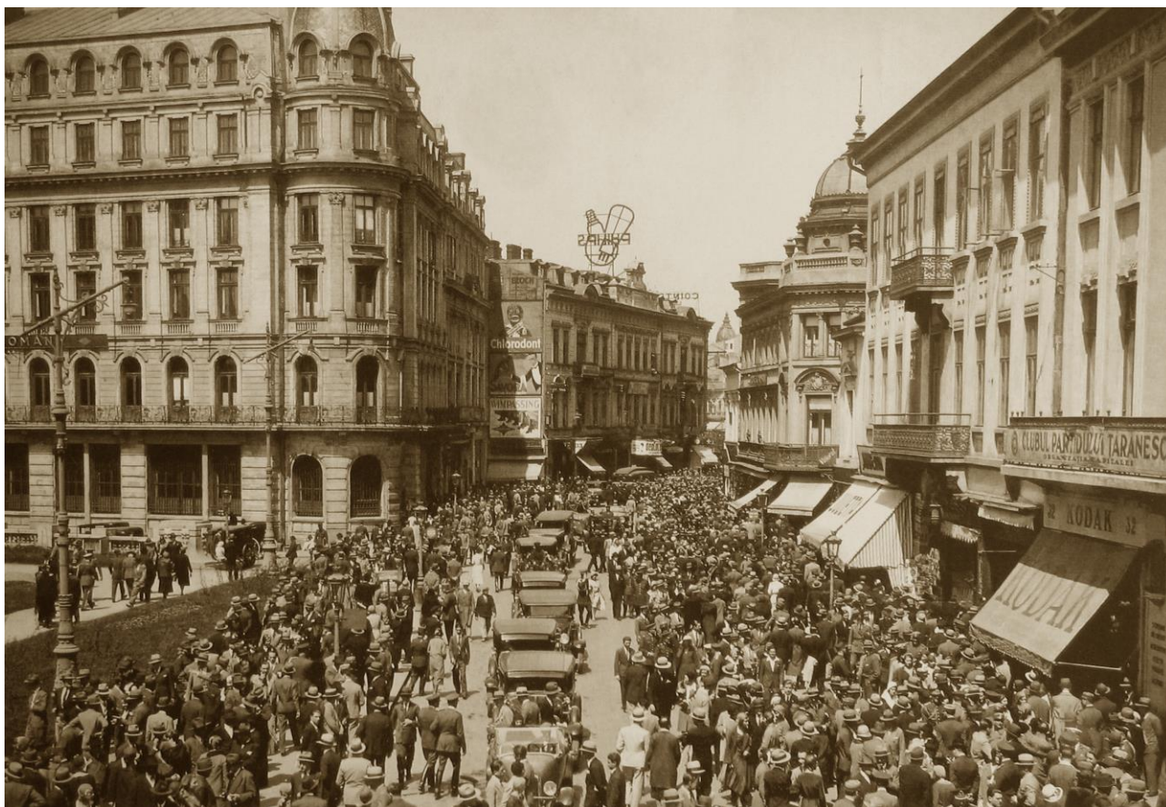
Calea Victoriei în 1930

Străzile pietonale Stavropoleos și Franceză , perpendiculare pe Calea Victoriei, parte din țesutul vechi medieval, flanchează muzeul pe partea de nord și de sud și conduc spre „centrul vechi”. Strada Stavropoleos este mai monumentală și conține și unul dintre cele mai frecventate restaurante din zonă (Caru’ cu Bere). Scara clădirilor de pe strada Franceză este mai redusă, rămășiță din vechiului cartier comercial. În proiectul inițial, Palatul Poștelor avea accese publice și din aceste două străzi.