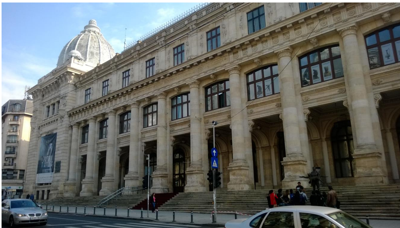
Muzeul Național de Istorie a României